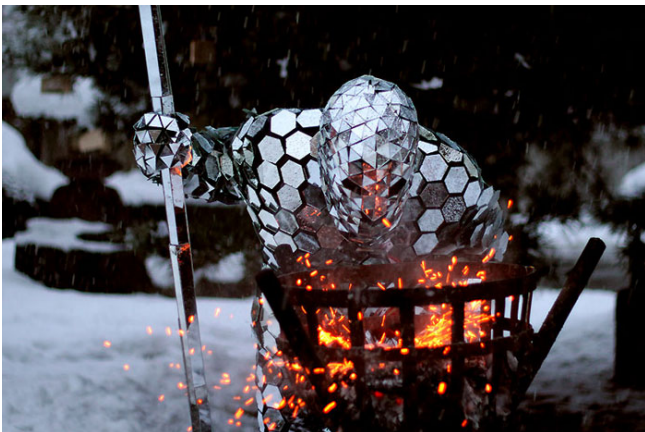
パフォーマンス「ミラー・マン」

開会式当日は、ミラー・マンがオリジナルの音楽にあわせ、机と椅子を使ったパフォーマンス「The Cutting Mirrors」で観客を魅了します。